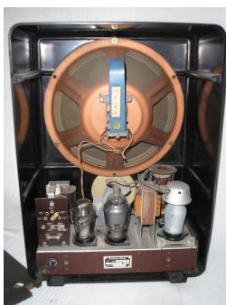
מקלט דגם VE301W